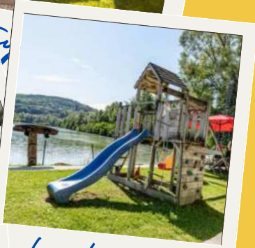
für die Minis